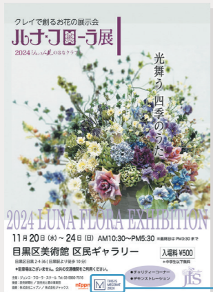
▲ 展覧会ポスターやニュースリリースなどにメセナマークを使用しています。