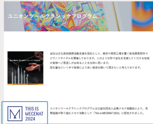
▲ 企業ホームページや株主通信などにメセナマークを掲載しています。